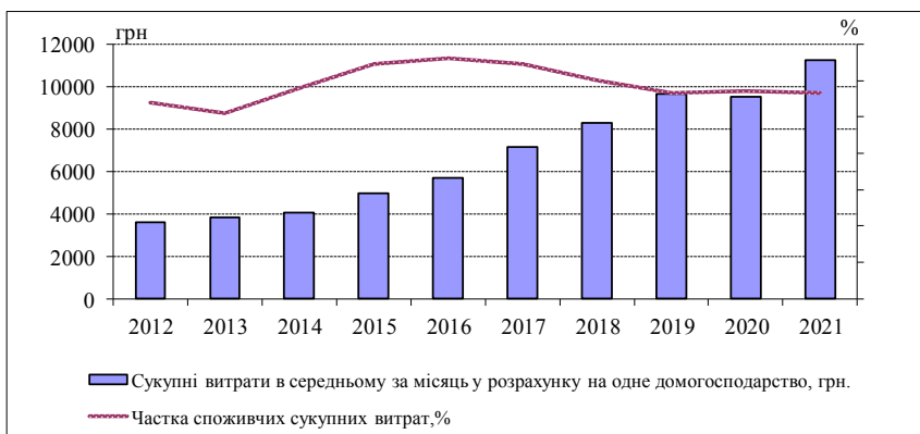
Рис. 1. Динаміка сукупних витрат за місяць у розрахунку на одне домогосподарство, 2012-2021 рр.

У ході дослідження динаміки сукупних витрат і питомої ваги споживчих витрат (рис. 1) виявлено, що у 2012-2021 рр. у розрахунку на одне домогосподарство в середньому за