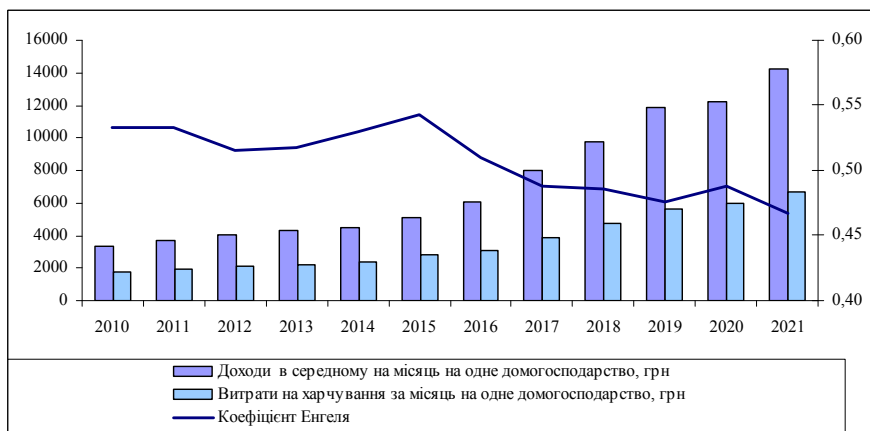
Рис. 2. Крива коефіцієнта Енгеля домогосподарств України, 2010-2021 рр.

Джерело: складено та розраховано авторами за [3, 4].